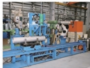
●トランスファーバーリング機