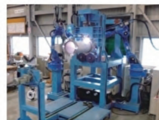
●SUSフランジ内外自動溶接機