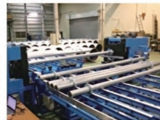
●フレア直管(両端)自動ライン