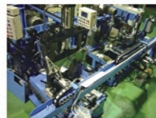
●自動フレア短管機