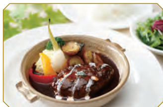
国産和牛ハンバーグ季節野菜添え