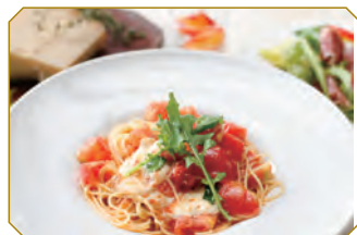
モッツアレラチーズとトマトの Pasta