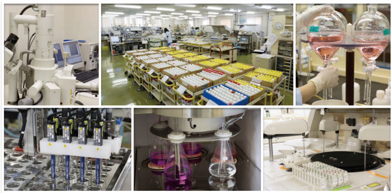
■分析センター：年間36万検体以上の各種分析業務を実施■