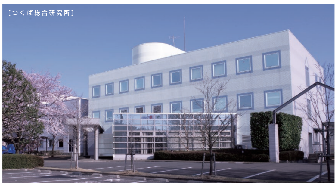
[つくば総合研究所]

アクア製品に関わるすべての技術の中核である「つくば総合研究所」。ここでは最新の水処理技術の研究開発とお客様の課題に対する技術調査・各種水質分析から、将来の新技术の芽となる研究開発に至るまで幅広く取り組んでいます。生産拠点であるつくば工場、関城工場、そして坂東工場とともに、研究、製造、物流を有機的に結合。アクアグループの持続的な成長を推進しながら、快適で安全な社会づくりと環境保全のために新たな価値の創造に挑戦し続けています。