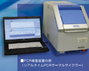
PCR検査装置の例 (リアルタイムPCRサーマルサイクラー)

アクアスでは、浴槽水のレジオネラ属菌について生菌を選択的に検出する遺伝子検査法「EMA-qPCR法」による検査を受託しています。特殊な処理によりレジオネラ属菌の生菌を選択的に検出するため、これまでより精度の高い検査結果を迅速に報告することが可能で、より正確に汚染の程度が判断できる指標として利用することができます。