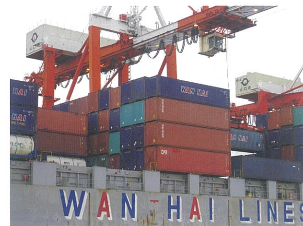
ガントリークレーン