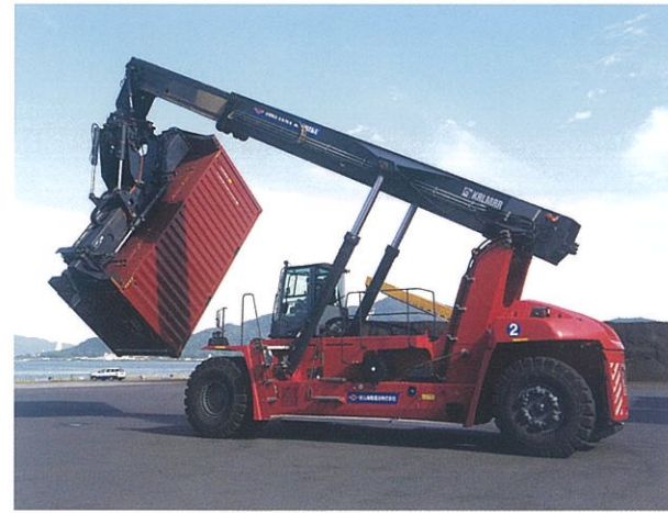
リーチスタッカー