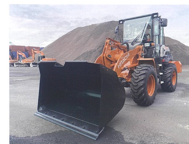
ホイールローダー&バックホー