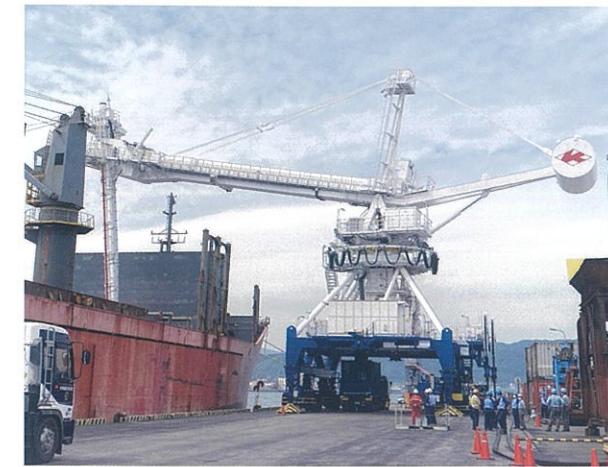
スクリー式連続アンローダー

▶ 主にバイオマス燃料（木材チップ、PKS（ヤシの実の殻）など）を船から卸すときに使用する重機