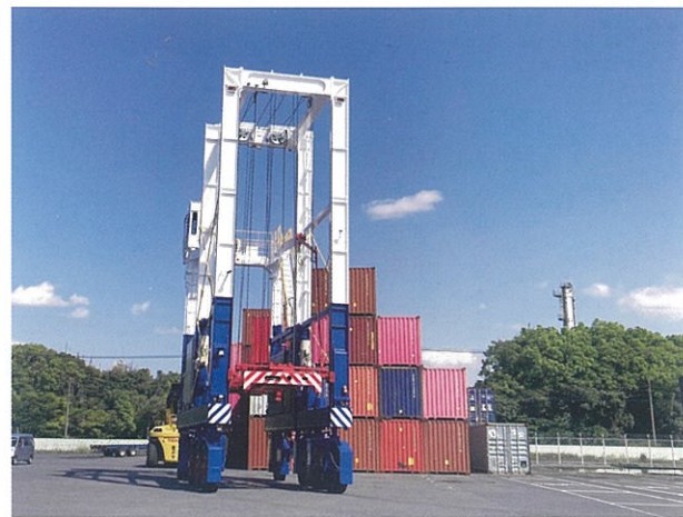
ストラドルキャリア