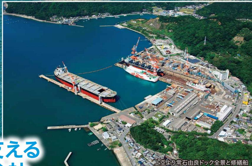
上空より常石由良ドック全景と修繕船