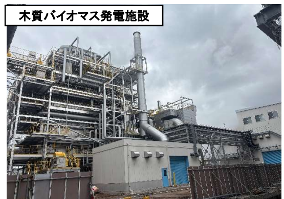
木質バイオマス発電施設