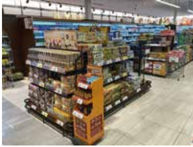
スーパーマーケット：千葉県野田市