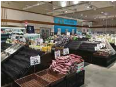
スーパーマーケット：千葉県市川市