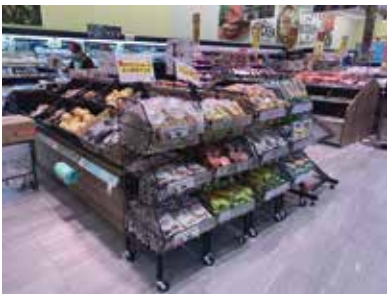
スーパーマーケット：千葉県我孫子市