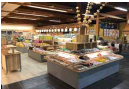
道の駅売店：埼玉県深谷市