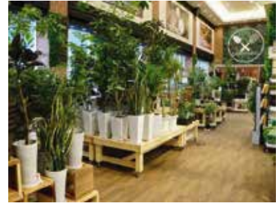
ホームセンター：埼玉県蕨市