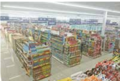
ドラッグストア：群馬県前橋市