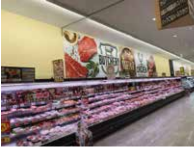
スーパーマーケット：埼玉県羽生市