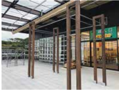
ホームセンター：茨城県日立市