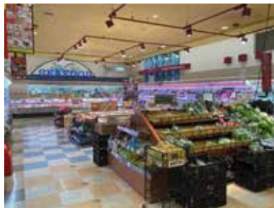
スーパーマーケット：埼玉県熊谷市