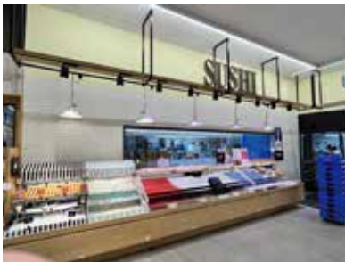
スーパーマーケット：神奈川県横浜市