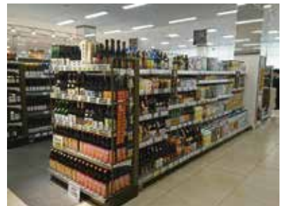
スーパーマーケット：埼玉県草加市