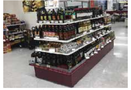
リカーショップ：埼玉県深谷市