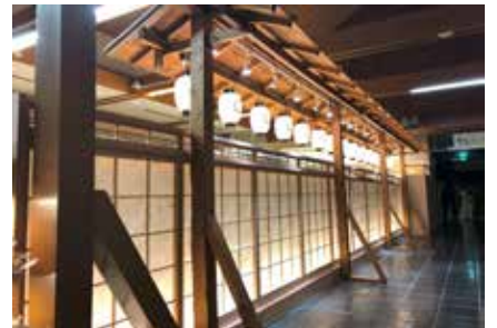
道の駅売店：埼玉県深谷市