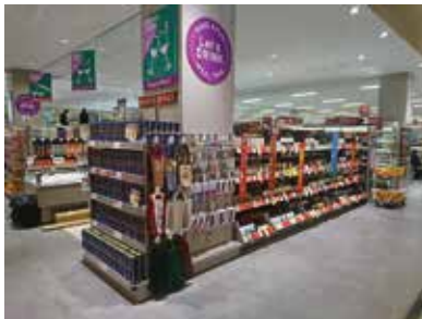
スーパーマーケット：埼玉県蕨市