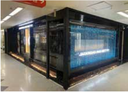
ショップ&オフィス：東京都中野区