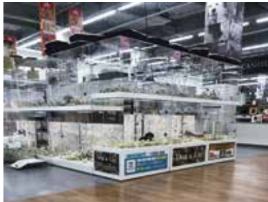
ホームセンター：愛知県一宮市