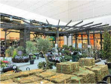
ホームセンター：埼玉県東松山市