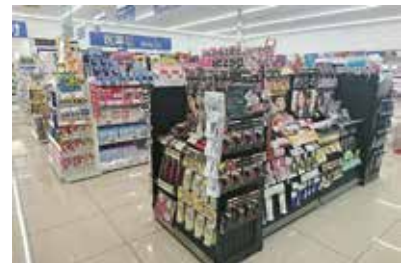
ドラッグストア：埼玉県川越市