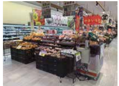
スーパーマーケット：埼玉県飯能市