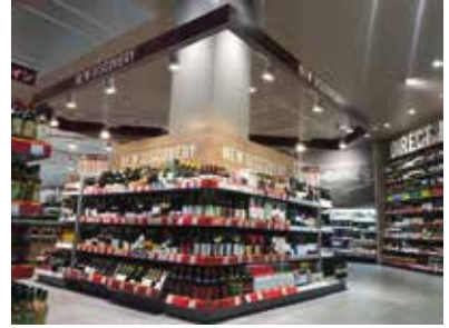
スーパーマーケット：埼玉県所沢市