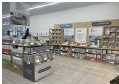
ドラッグストア：千葉県千葉市