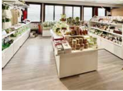
ミュージアムショップ：埼玉県深谷市