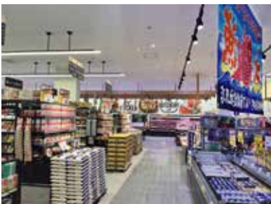
スーパーマーケット：群馬県前橋市