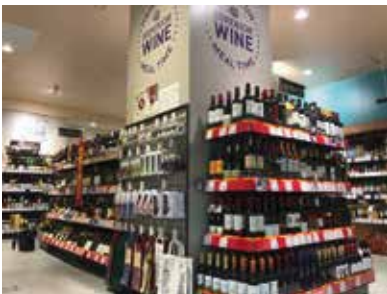
スーパーマーケット：埼玉県さいたま市