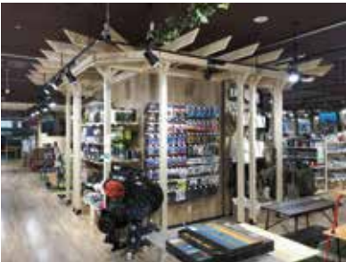
ホームセンター (キャンプ用品)：福岡県宗像市