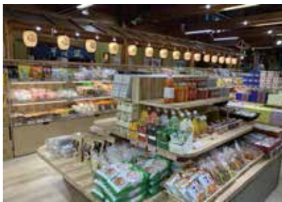
道の駅売店：埼玉県深谷市