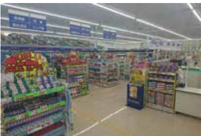
ドラッグストア：宮城県仙台市