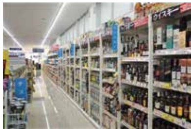
ドラッグストア：千葉県香取市