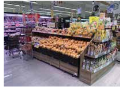
スーパーマーケット：東京都東大和市