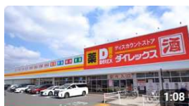
ダイレックス の1日