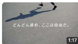
作業風景 ダイジェスト