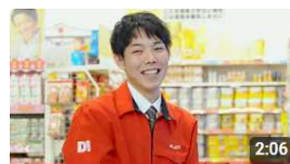
社員インタビュー 新卒社員