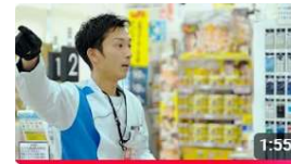
社員インタビュー 店長