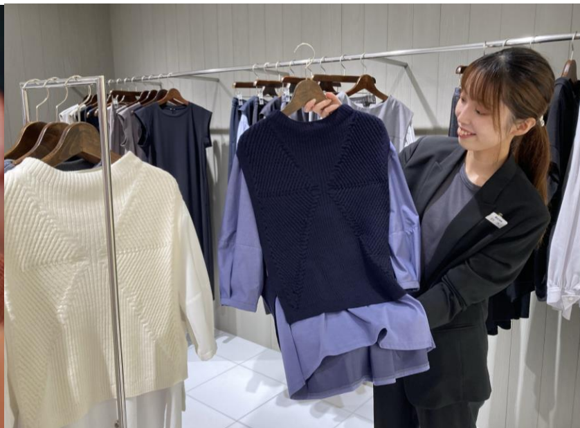
スタイリストは『俳優』