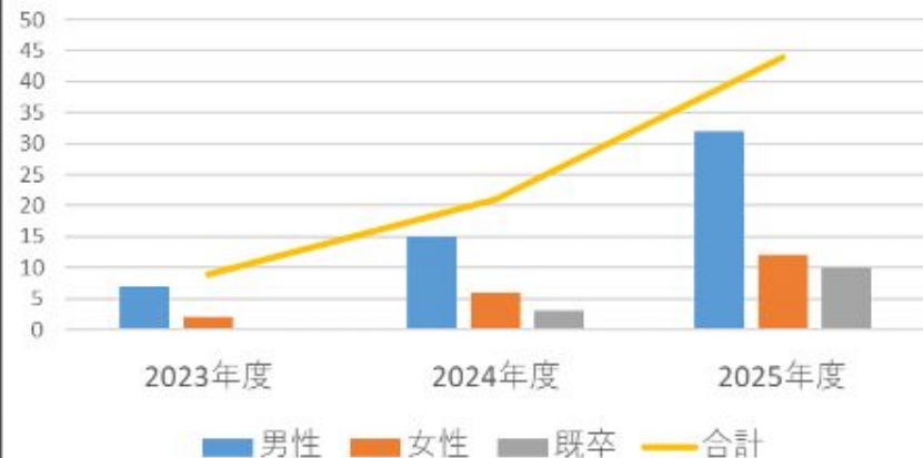
過去3年の入社数推移

お問い合わせは当社へご相談ください。 ごらんの通り、弊社では3月ギリギリ まで職場見学・応募を受け付けします。 お気軽にお声がけください。