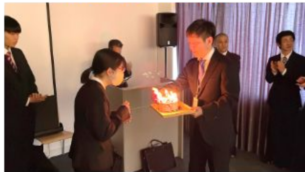
支店長・先輩社員との座談会