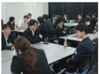
前年度入社社員との座談会