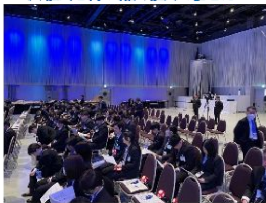
入社式を待つ新入社員の皆さん