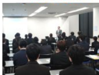
ハラスメント研修