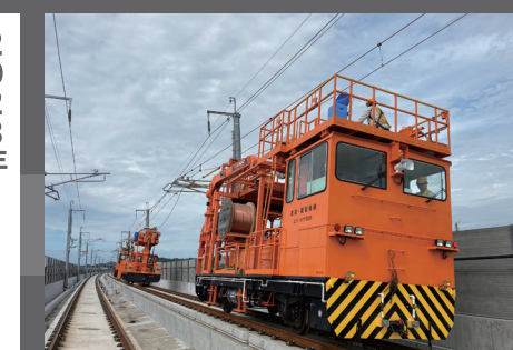
北陸新幹線(金沢~敦賀間)工事に携わる