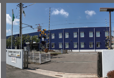
研修センター新設