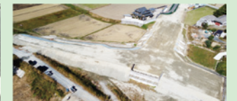
桑名大安線道路改良工事