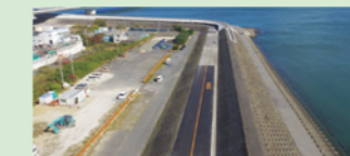
城南第一地区海岸高潮対策工事