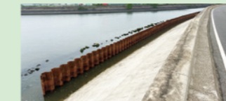
一級河川鍋田川地震・高潮対策工事