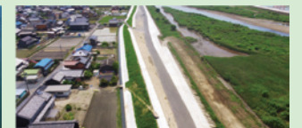
二級河川員井川 河川改修（堤防強化対策）工事