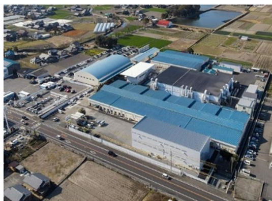
本社及び本社工場 香川県善通寺市