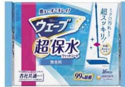
おそうじ用品 自動包装用フィルム