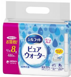
ウェットティッシュ 手揚げ袋