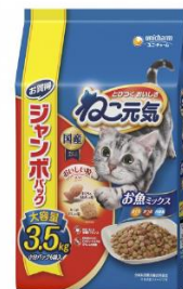
ペットフード 膾貼袋 (合掌袋)