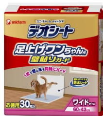
ペットシート 手揚げ袋