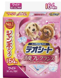
ペットシート 手揚げ袋