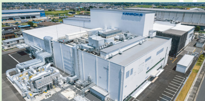
第三工場B棟(2024年竣工)

当社では製造キャパシティの増強はもちろんのこと、今後の業界・世の中の変化に対応していく為、最新鋭の設備を擁した新工場を立ち上げました。2022年竣工の令和プラントではデジタル印刷機を導入し小ロットへの対応力を高め、多様なニーズにお応えしつつ環境に配慮した新たな印刷手法を実現。