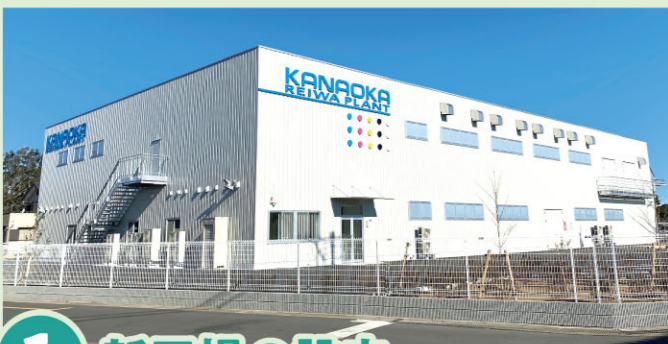
1 新工場の設立 令和プラント(2022年竣工)