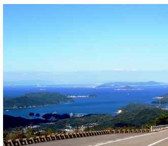
伊勢志摩スカイライン

伊勢と鳥羽を結ぶ、全長 16.3km の“天空のドライブウェイ”。山頂展望台では、伊勢志摩や伊勢湾の大パノラマが展開し、天候に恵まれれば富士山まで眺望できます。さらに眺望と四季の花木で彩られた「さんぼ道」や、ゆったりした気分で眺望が楽しめる「展望足湯」などがあります。また、山頂広場には、昔ながらの可愛い丸型の「天空のポスト」が設置しており、「恋人の聖地」に選定されています。