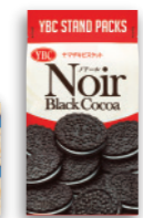
※発売当時のパッケージ