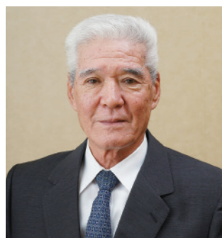
ヤマザキビスケット株式会社 代表取締役社長