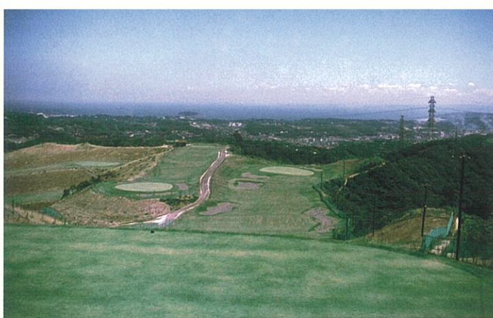
ダイヤモンドコース4番(オープン当時と現在)