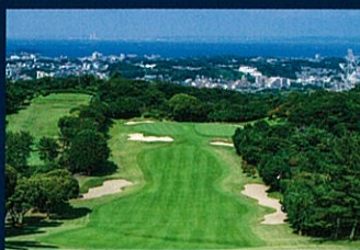
No.4 Par4 390Yards