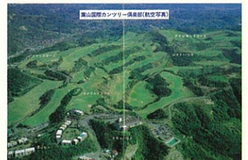
1973年頃の会員募集パンフレット