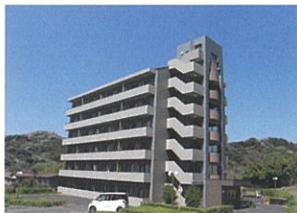
ビュー葉山(社員寮)