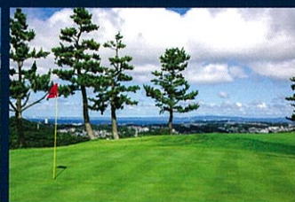
No.12 Par3 103Yards