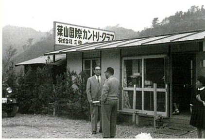
創業当時 現場事務所