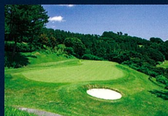
No.4 Par3 105Yards