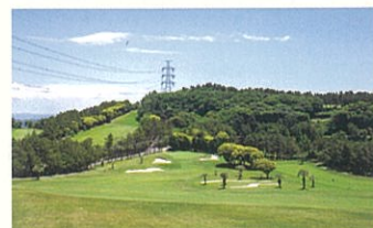
エメラルドコースのワングリーン化工事