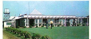
初代クラブハウス