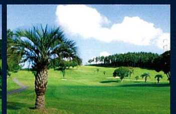
No.11 Par4 263Yards