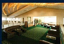
Lounge & VIP Room