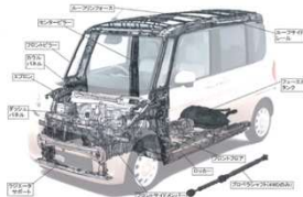
サイドインナーフレーム アッセンブリ