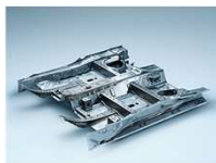
フロントフロアパンアッセンブリ