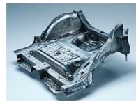
リアフロアパンアッセンブリ