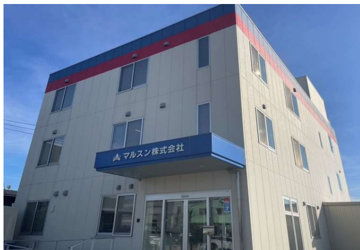
<新事務所棟> 2022年設立