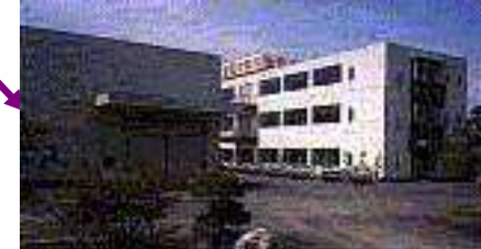
Suruga Technical Center