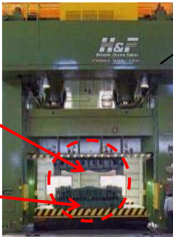
金型をプレスにセット