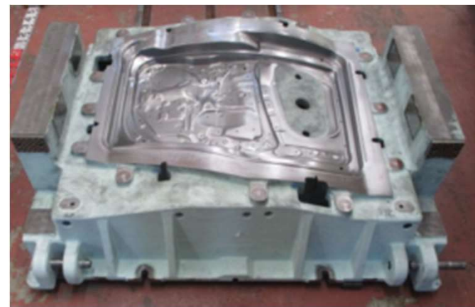
自動車のドアを生産するための金型