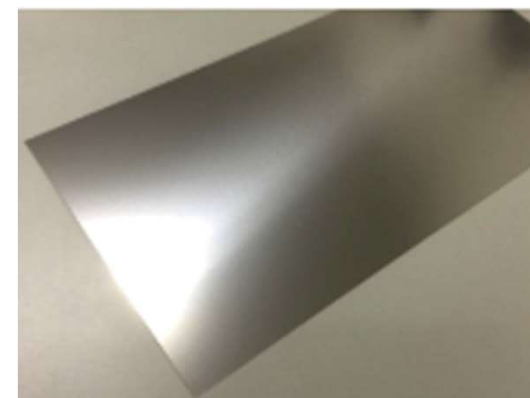
材料は鉄板を使用します