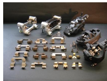
<フォーミング製品>