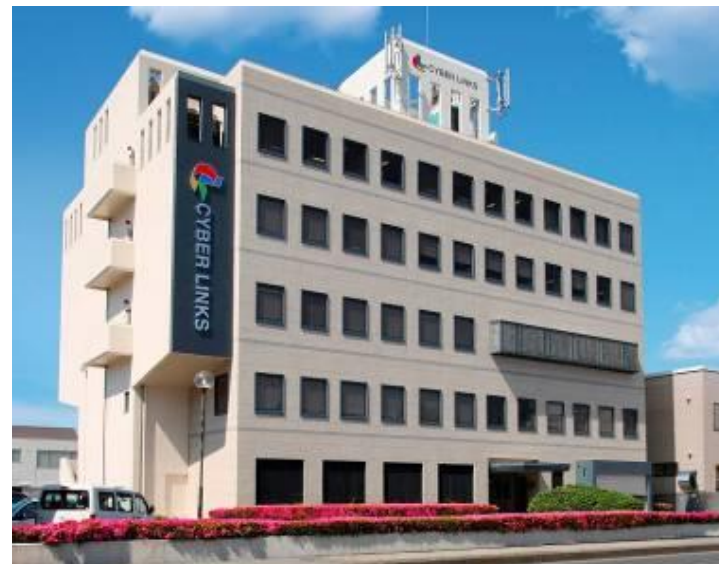
本社ビル(和歌山市紀三井寺)