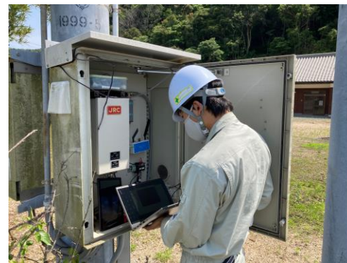
雨量観測用の通信機器の点検

主な業務は雨量の観測設備(雨量計)、河川の水位観測設備(水位計)、ダム の運用管理を行っている設備などの保守作業です。設備がある場所に向かい、施設内のパソコンやネットワーク機器や外にある放流用のサイレン・スピーカーが正しく動いているかを確認・点検します。