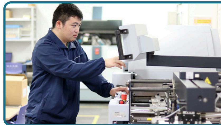
データプリントサービス