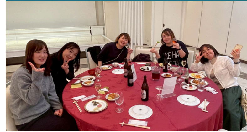
社内懇親パーティー