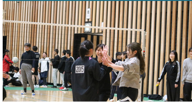
ソフトバレーボール大会