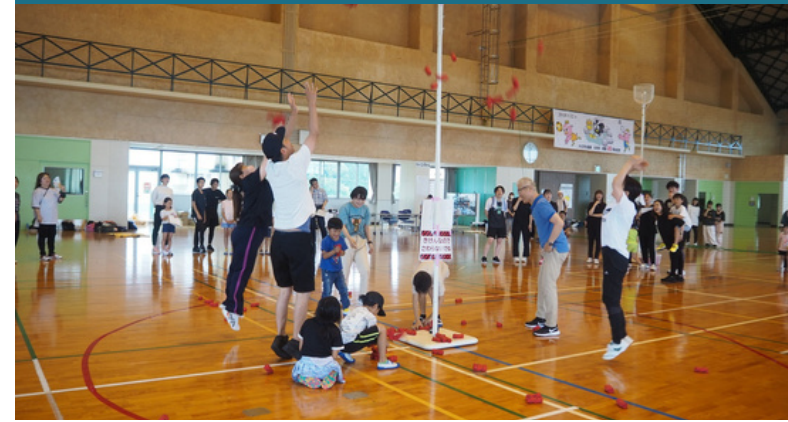
玉入れ(アジャタ)大会