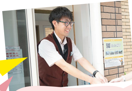
チケットゲート U. R.