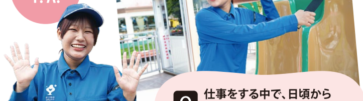
アトラクション T. A.

A 乗物の動きや音、振動などを日頃からよく観察するようにしています。些細な変化に気付くことで、メンテナンス業務をより効率的に行えるよう心がけています。