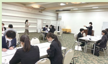
ビジネスマナー研修

入社後概ね1年間、業務の指導係として、また身の回りの事を気軽に相談できるメンターのような存在として、教育係を配置します。