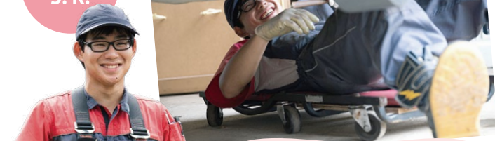
メンテナンス S. K.

A 私は普段、社員寮で暮らしています。月に数回希望休を申請し、そのタイミングで家族や友人と予定を合わせて過ごし、プライベートも大切にしています。