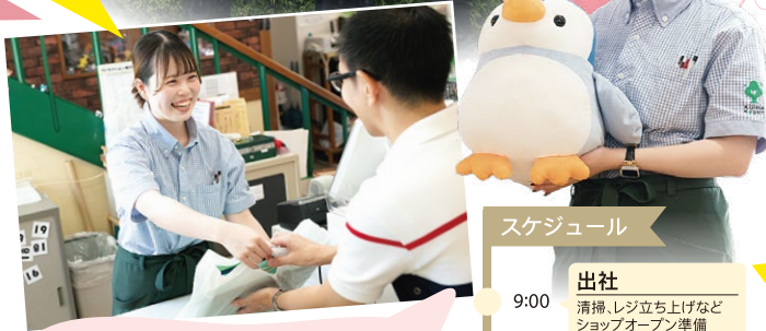
物販 I. U.

日本初の木製コースター“ジュピター”をはじめとする九州有数のスリルライド群に加えて、多数の屋内型施設も導入し、子どもはもちろん、大人も楽しめるアトラクションがいっぱいです。