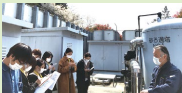
社内施設・設備研修