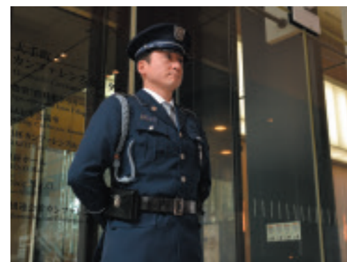
①警戒業務(出入管理)