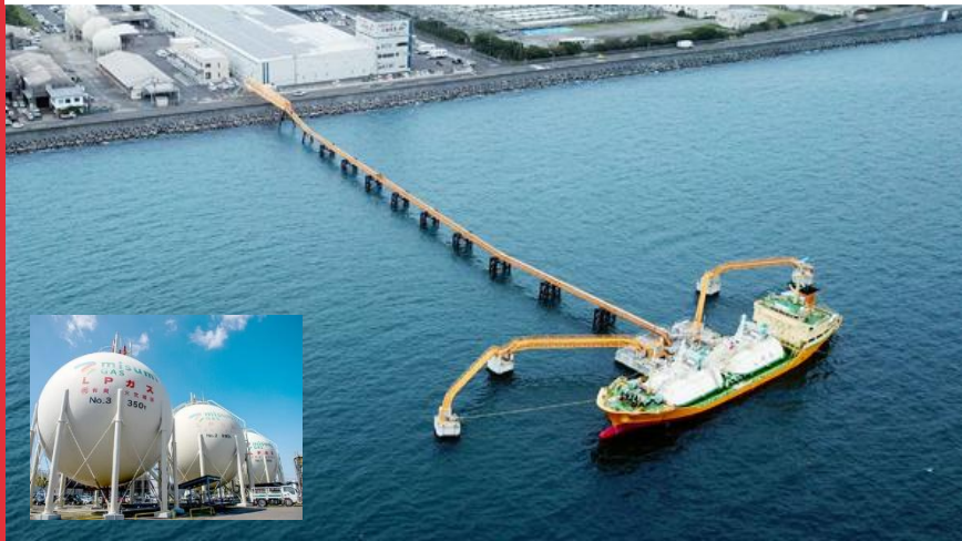
【鹿児島島海上基地】