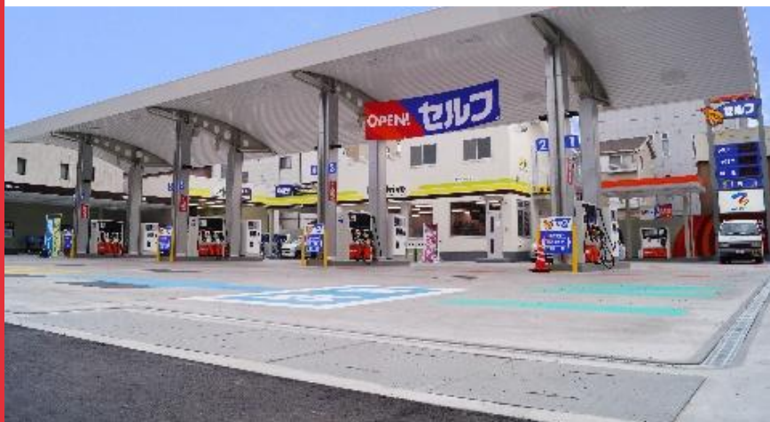
【サービスステーション】