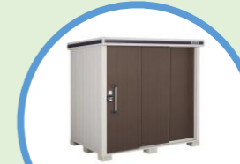
エクステリア商品 [エルモ]