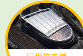
屋根施工例 [さいたま スーパーアリーナ]