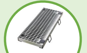
グレーチング 製品