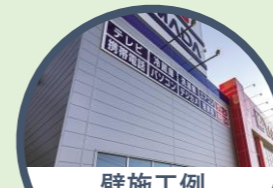
壁施工例 ヤマダデンキ [テックランド古川店 (宮城県大崎市)]