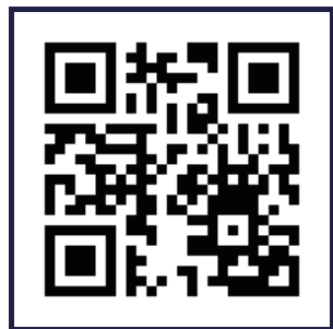
インプレッション 動画