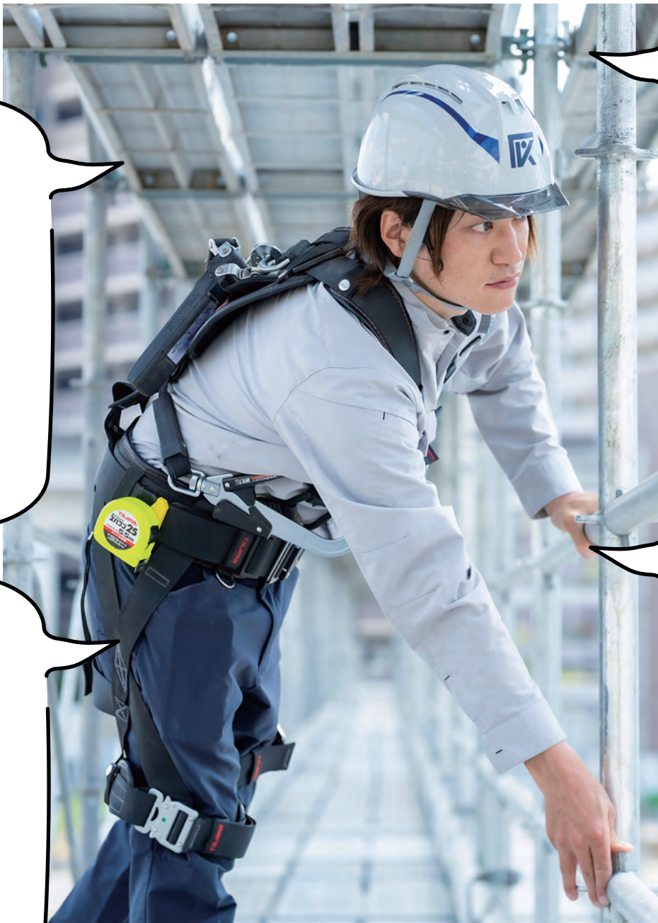
入社9年目 | 建築部 | A.S

A.これから先、もし自分が現場のトップに立つようになったら、全員が無理なく働ける「ゆりのある現場」を作りたいと思っています。今いる仲間たちや職人さんたちと怪我やトラブルなく、長く一緒に働きながら、将来はこの会社を「地元の人たちに自慢できる」ぐらいに、誰もが名前を知ってる会社になりたいですね！ そのポテンシャルは十分ある会社だと思っています。