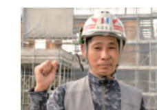
N.Y 2018年入社 職長

私は沖縄県出身で東京に憧れがあり、入社のタイミングで思い切って東京へ上京してきました!皆さんもやりたいことがあったら、私と同じようにそこへ飛び込んでみるのも良いのではないのでしょうか。初めての社会人生活で不安な部分もあるかと思いますが、私たちが全力でサポートして参ります!