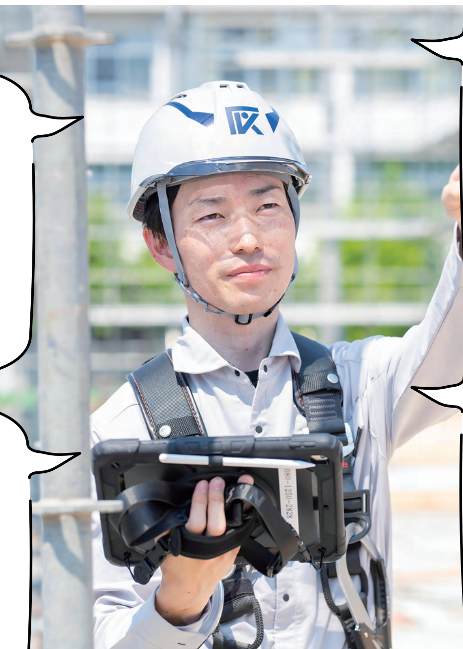
入社21年目 | 建築部 | S.K

A.これまでさまざまな規模の現場を経験して、個人としての目標はある程度達成できたなと感じています。なのでこれからは、自分の経験を会社全体の成長につなげていきたいと考えています。今いるベテランの技術をしっかり若手に継承していけるように、そのつなぎ役を務められるような準備をしていきたいと思っています。そのために今は、自分でできることの幅を広げるように心がけています。