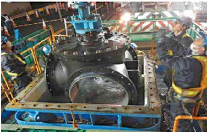
インサートバルブ設置