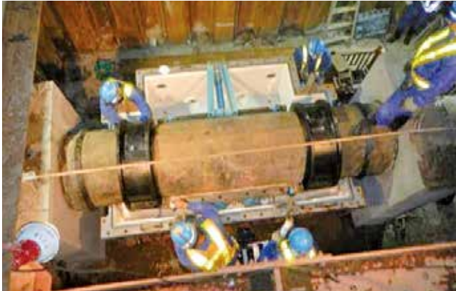
既設配水本管切断前