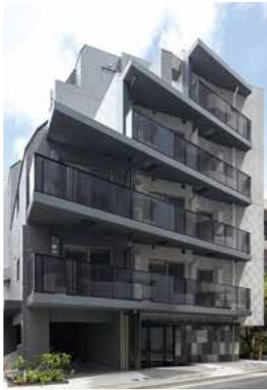
北区田端新町3丁目 RC造 地上7階建 26戸