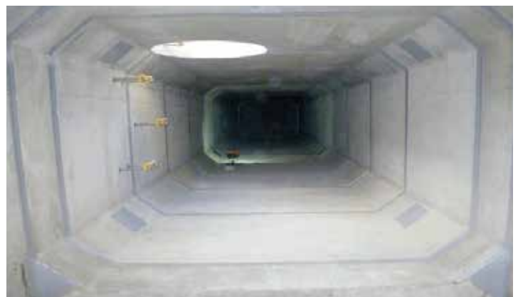
石神井川地下湧水・導水施設工事(北区)