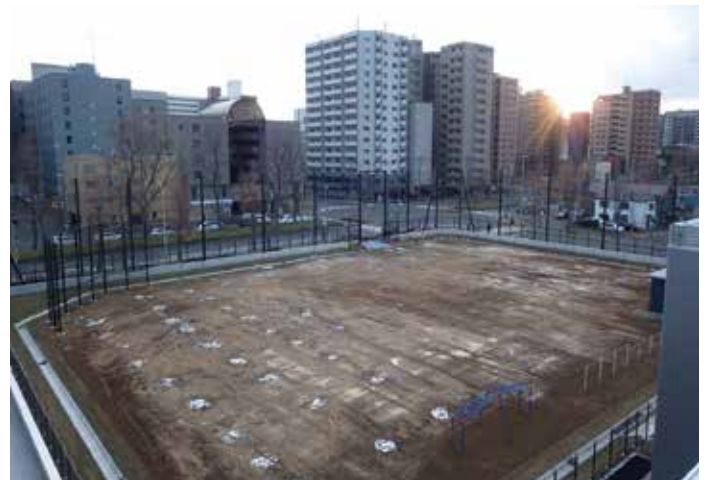
小学校グラウンド施設工事(札幌市)