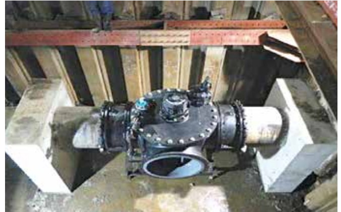
インサートバルブ設置完了