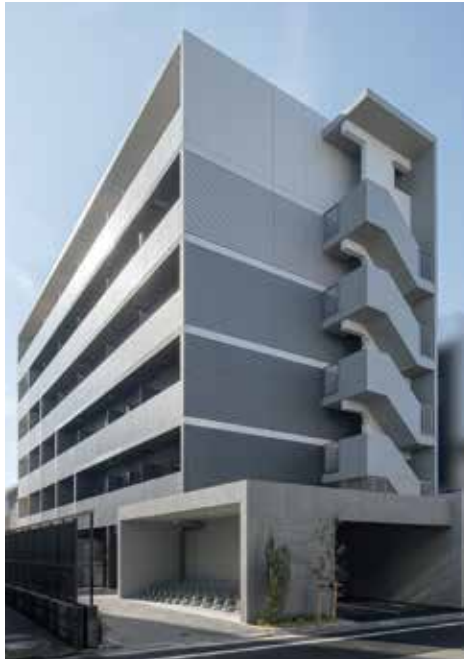
大田区矢口3丁目 RC造 地上6階建 38戸