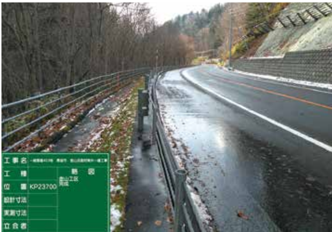
道路改良工事(恵庭市)

恵まれた自然環境を大切にし、宅地造成、道路敷設、架橋、河川改修、 上下水道敷設などの社会資本の整備に貢献しています。