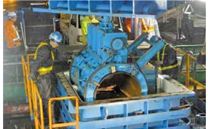
既設配水本管切断撤去