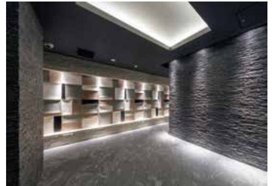
江東区木場3丁目 RC造 地上9階建 42戸