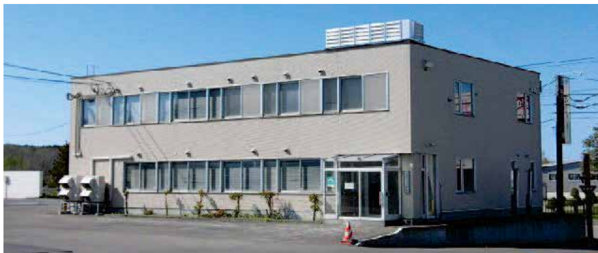
北広島営業所 (北海道北広島市)