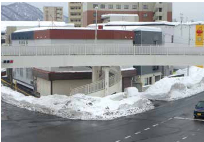
歩道橋補修工事(札幌市)