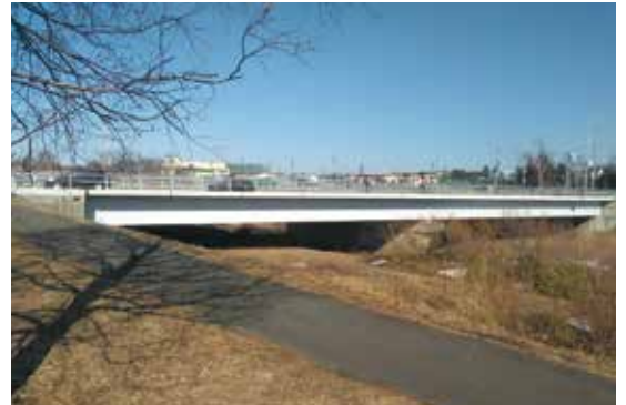
橋梁補修工事(札幌市)

恵まれた自然環境を大切にし、宅地造成、道路敷設、架橋、河川改修、 上下水道敷設などの社会資本の整備に貢献しています。