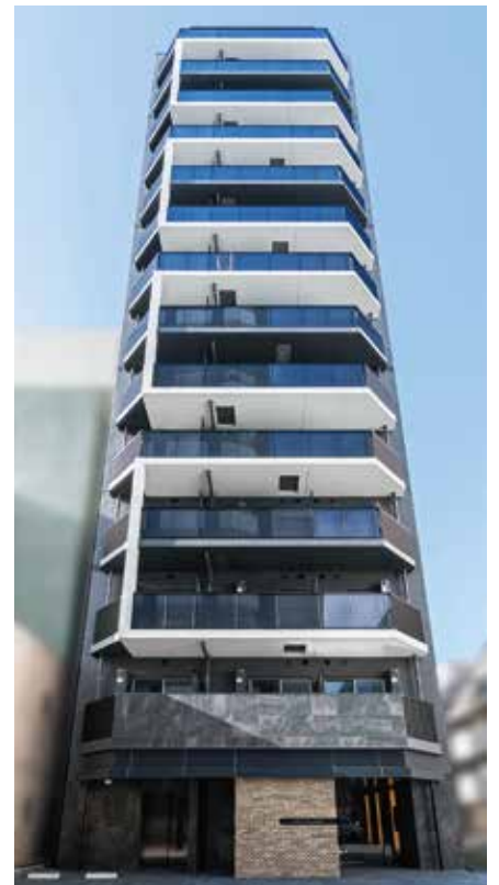
荒川区東日暮里5丁目 RC造 地上14階建 29戸