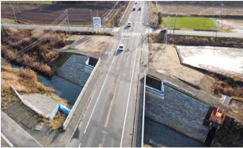
河川法面改良工事(滝川市)