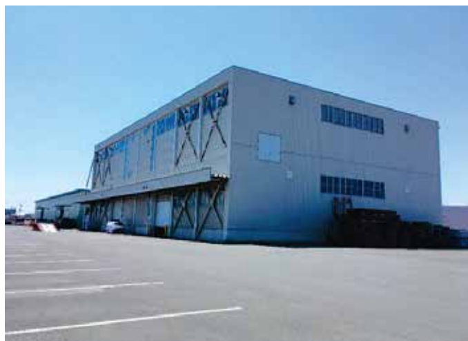
苫小牧営業所(北海道苫小牧市)