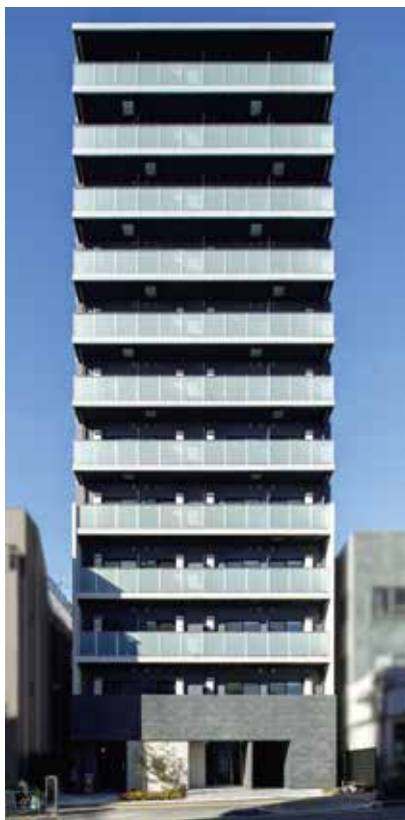
江東区大島2丁目 RC造 地上12階建 44戸