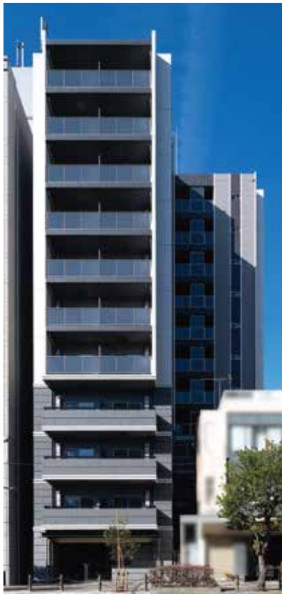
北区王子2丁目 RC造 地上12階建 44戸