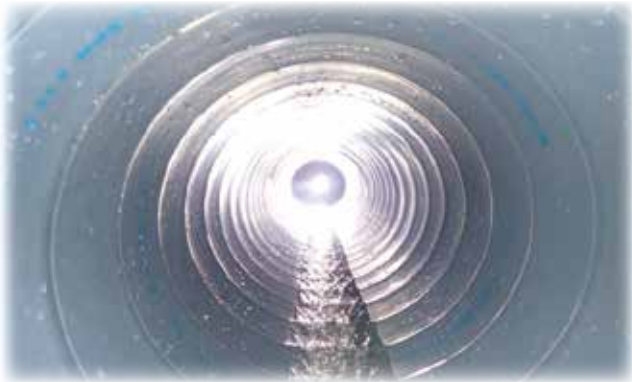
上原下水SPR工事(渋谷区)