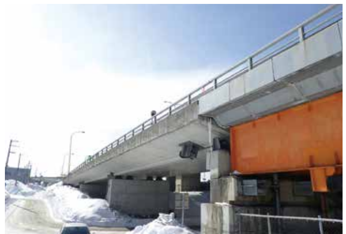
橋梁補修工事(札幌市)