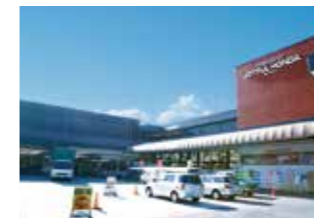
● 生鮮館 守谷店 (ジョイフル本店内)