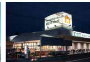
● MEAT Meet 新栄店