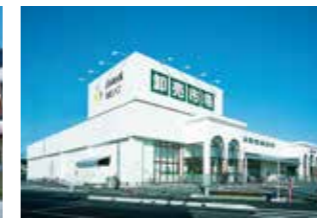
● 卸売市場 古河店