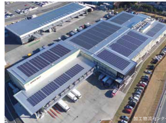
加工物流センター