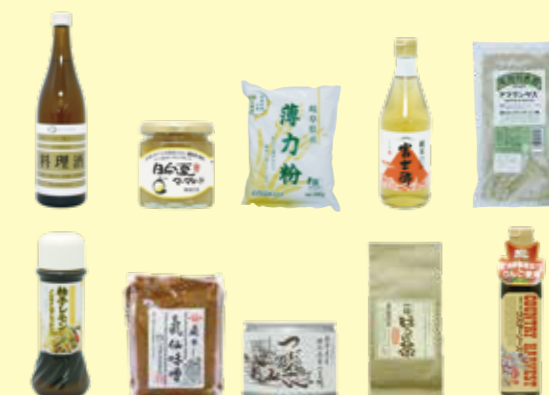
良質で信頼できるアイテムを集めた「食の学校」推奨品の一部をご紹介します。

「食の学校」では、農・水・畜産業、食品加工メーカー、流通、レストラン、地方自治体など、さまざまな分野で「食」の仕事に携わる人たちが、「おいしくて安全な食べものを食卓に取り戻そう」という、共通の志をもって「会員」となり、フォーラムや定例セミナー、産地研修などを通して、「いのちをすこやかに育む」食の本質を学んでいます。