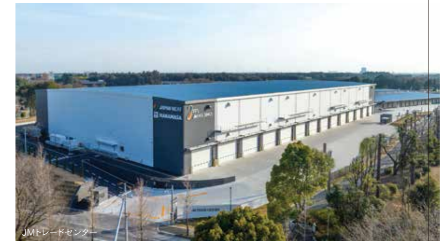
JMトレードセンター

そして2023年5月、茨城県つくば市に常温倉庫(約8,000坪)と冷蔵倉庫(約1,500坪)の2棟からなる、JMトレードセンターが誕生しました。さらに2024年9月には埼玉県八潮市にハナマサ配送センターが、同年10月には大阪府交野市にハナマサ大阪センターを開設しました。盤石の物流体制で商品の安定供給をサポートしています。