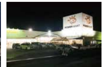
● パワーマーケット 住吉店