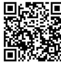
コース管理の 仕事【動画】