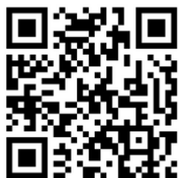
裾野CC ホームページ