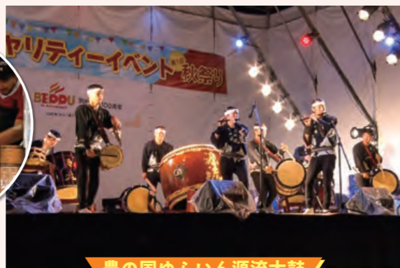
豊の国ゆふいん源流太鼓