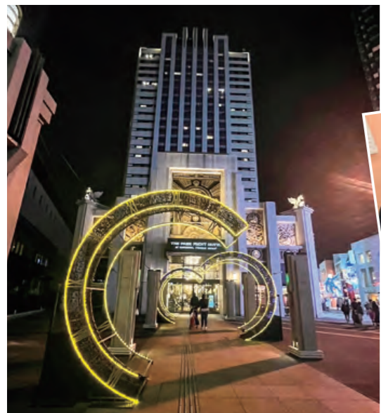
ザパークフロントホテルアット ユニバーサル・スタジオ・ジャパン

ユニバーサル・スタジオ・ジャパンより徒歩1分、パークの正面に位置するオフィシャルホテルです。 時空を超えたアメリカ旅行をコンセプトにした空間で「非日常」の世界と共にパークの余韻を楽しめます。タイムマシンをモチーフにしたエレベーターで辿り着いた部屋から見渡す「パークの夜景」は、記憶と記録に残るひとときを演出しています。