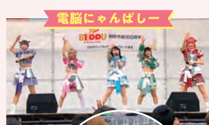
電脳にゃんぱしー