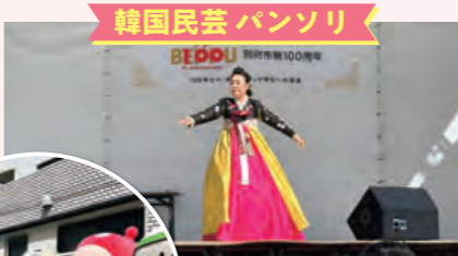
韓国民芸 パンソリ