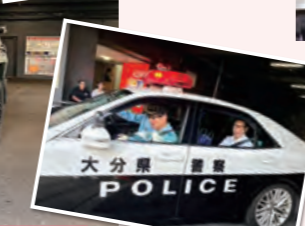
パトカー・白バイ・自衛隊コーナー