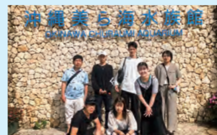
7/4~7/6 @沖縄美ら海水族館