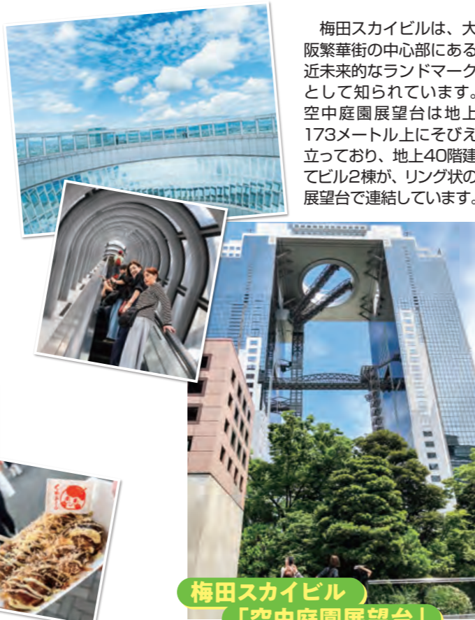
梅田スカイビル 「空中庭園展望台」

梅田スカイビルは、大阪繁華街の中心部にある近未来的なランドマークとして知られています。空中庭園展望台は地上173メートル上にそびえ立っており、地上40階建てビル2棟が、リング状の展望台で連結しています。