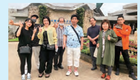
6/13～6/15 @沖縄美ら海水族館