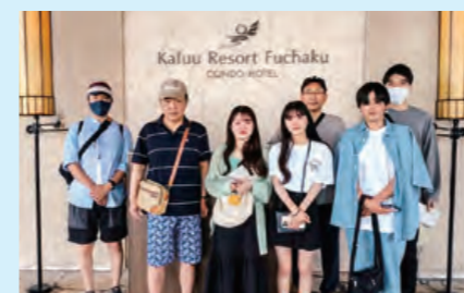
5/23～5/25 @カフーリゾート