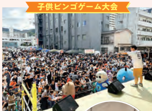
子供ビンゴゲーム大会