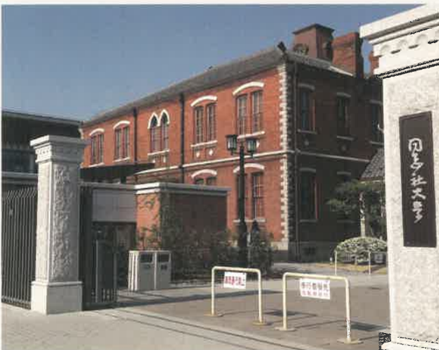
京都府京都市 大学