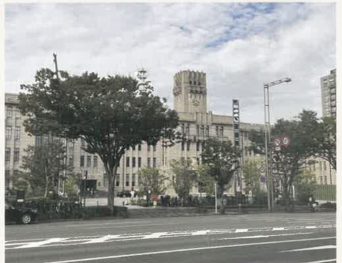
京都府京都市 公共施設