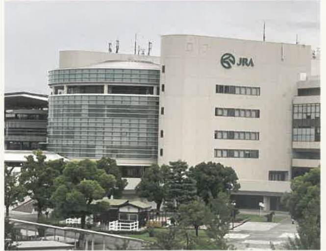
京都府京都市 商業施設