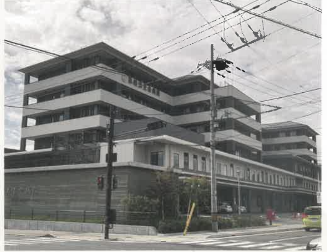
京都府京都市 病院施設