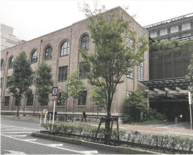
京都府京都市 ホテル