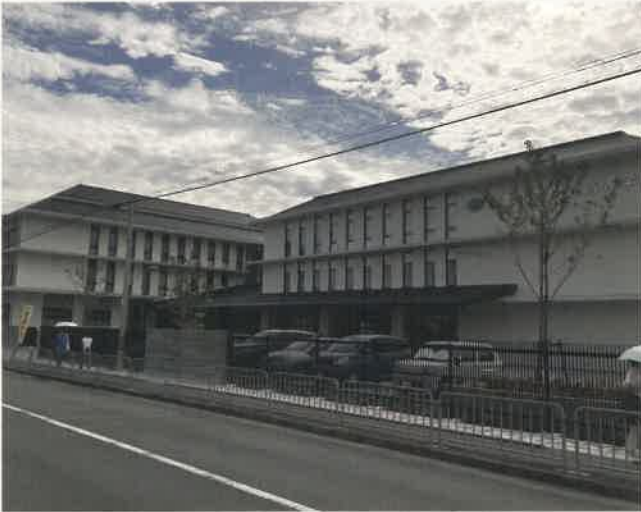
京都府京都市 高等学校