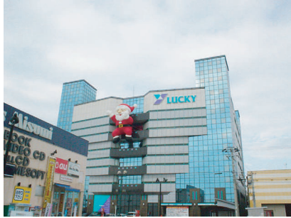
パーラーラッキー新栄店

ディスプレイ演具の企画、開発・デザインや各種マネキンなどにより多彩な商空間創りをご提案いたします。