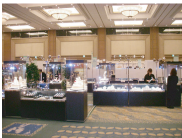
鶴屋百貨店 ホテル日航 鶴翔会

レイアウトから装飾、設営まで全て弊社で行います。写真の構成は弊社のレンタル備品です。