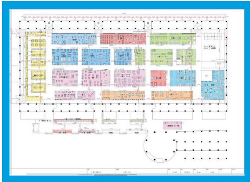
グランメッセ熊本 図面（レイアウト）

衣料、小物雑貨、食品などのイベントに関する陳列台、ケースを数多く揃えております。 県内外のイベント催事に携わっています。