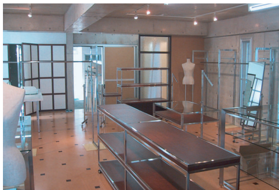
鹿児島 ひさご屋新店舗