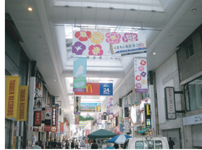
熊本市街 熊本花絵巻