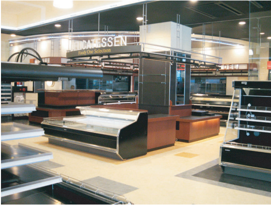
Foody One 浜線店