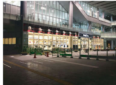
Foody One 森都心店