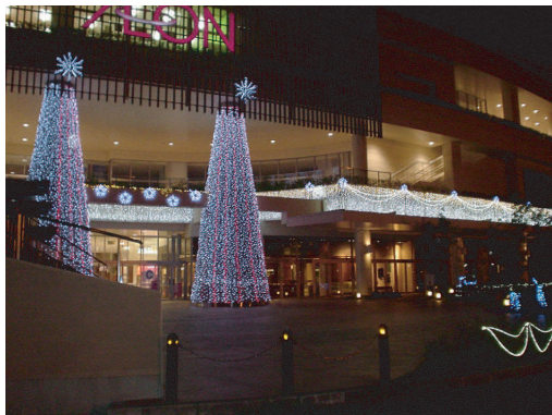
鹿児島イオンモールクリスマスイルミネーション