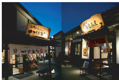
桜の馬場 城彩苑 サイン工事