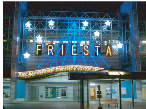
宮崎駅フレスタ野外イルミネーション