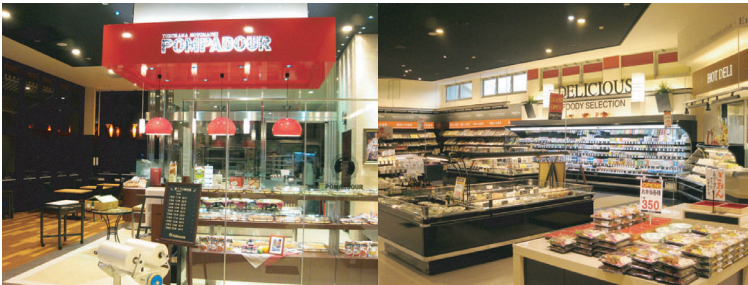
Foody One 楠店