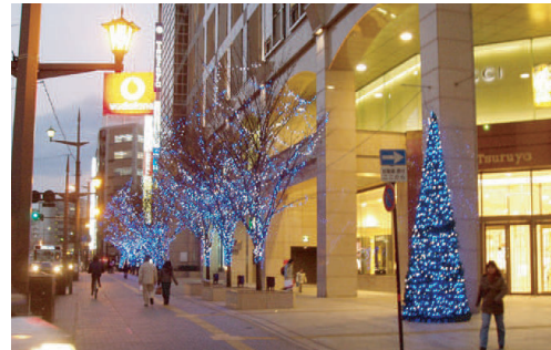
通町街路樹イルミネーション