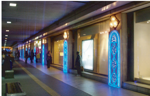
鶴屋百貨店前イルミネーション