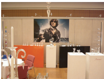
鶴屋百貨店 東館 7F バカラ