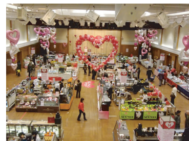
鶴屋百貨店 東館 7F バレンタイン