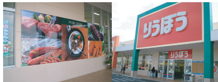
沖縄りうぼうグループ、郊外型スーパーのサイン工事