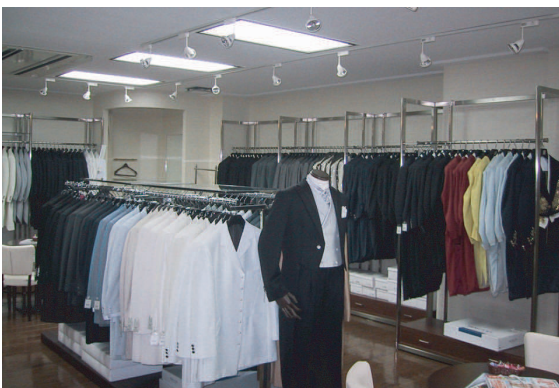
鹿児島 丸屋プライダル