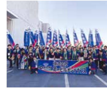
全国ビルクリーニンググランプリ2025 優勝 団体戦で初の頂点 磨き続けた品質が日本一に

社内行事や自由参加の同好会が充実。部署の垣根を越えて盛り上がります！ 仕事上では交流の少ない先輩社員とも仲良くなれる機会なので、ぜひ皆さんの参加をお待ちしています。 仕事と遊びのメリハリをつけて、社会生活を一緒に楽しみましょう！