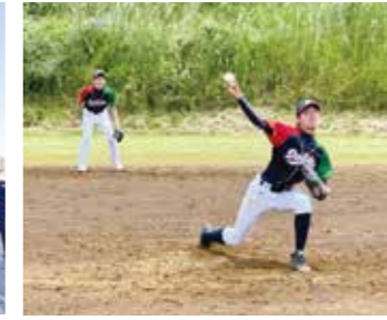
ビルメンテナンス野球大会 3位入賞 チーム一丸で年々順位アップ中