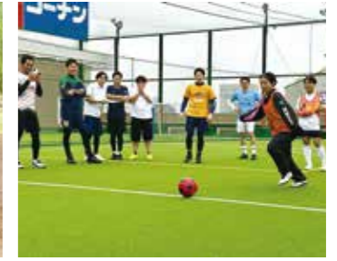
部署・年齢を越えて大熱狂 50人参加のフットサル大会