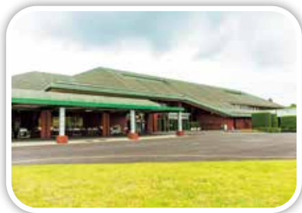
クラブハウス全景