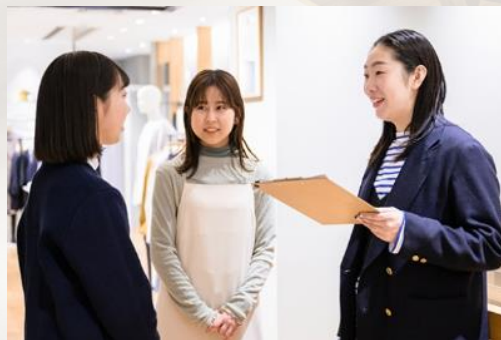
終礼 引継ぎ業務確認