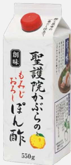
もみじおろしぽん酢