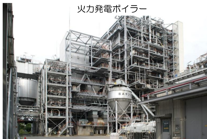
火力発電ボイラー