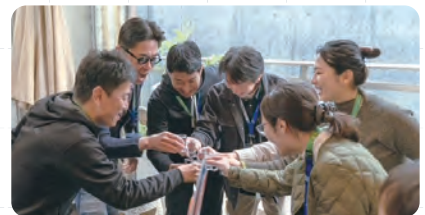
コミュニケーション促進制度