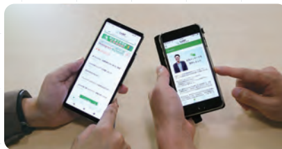
従業員専用アプリ“LeAF”