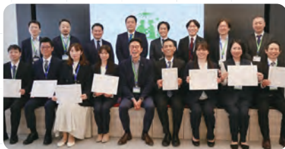
エイジフリーアワード