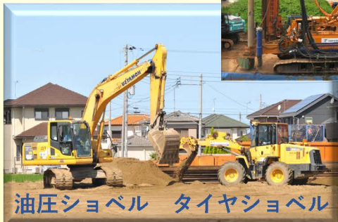
油圧ショベル タイヤショベル