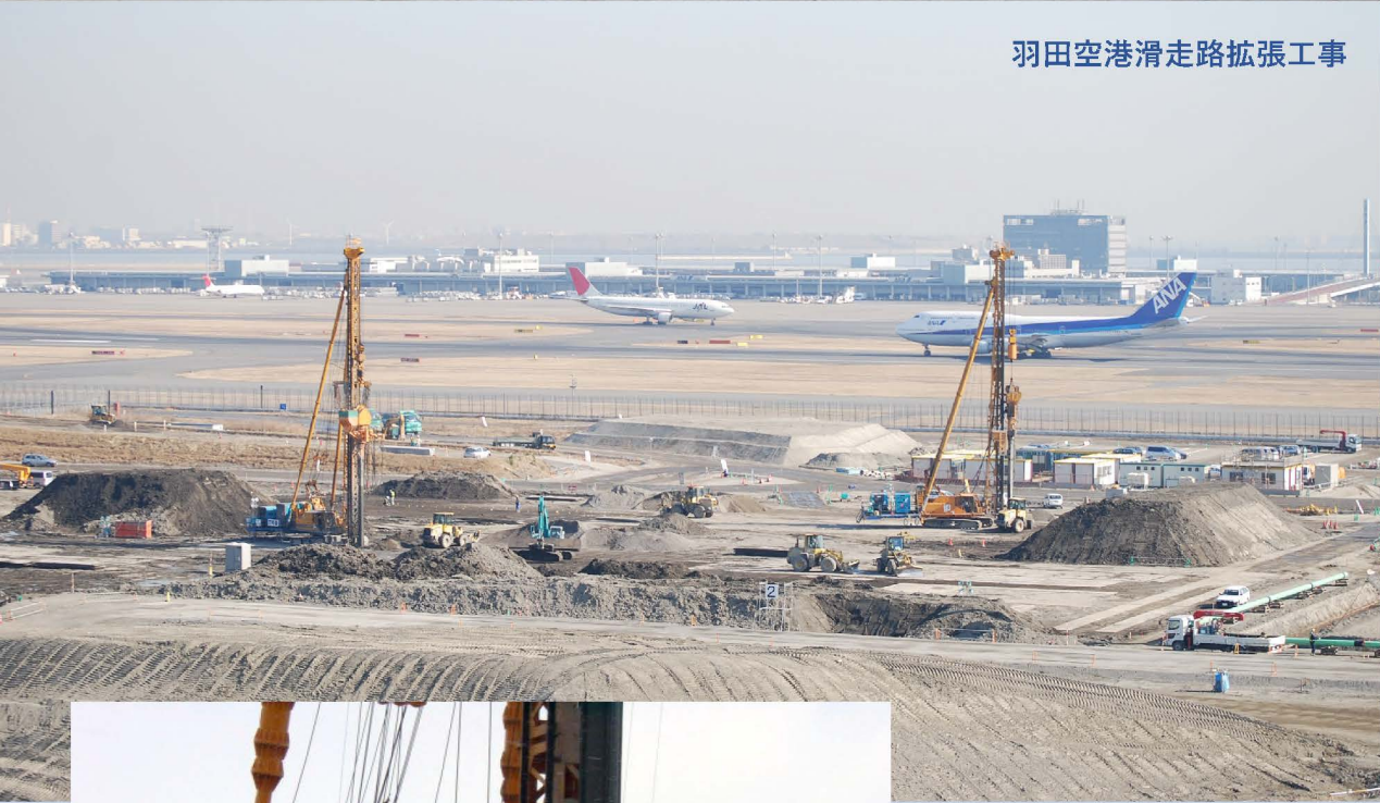
羽田空港滑走路拡張工事