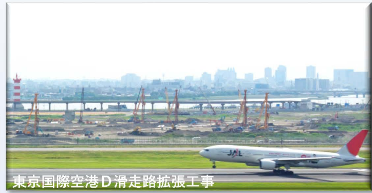
東京国際空港D滑走路拡張工事