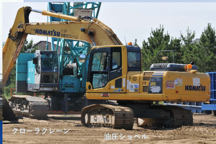
クローラクレーン