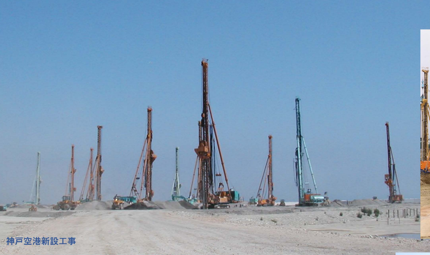
神戸空港新設工事