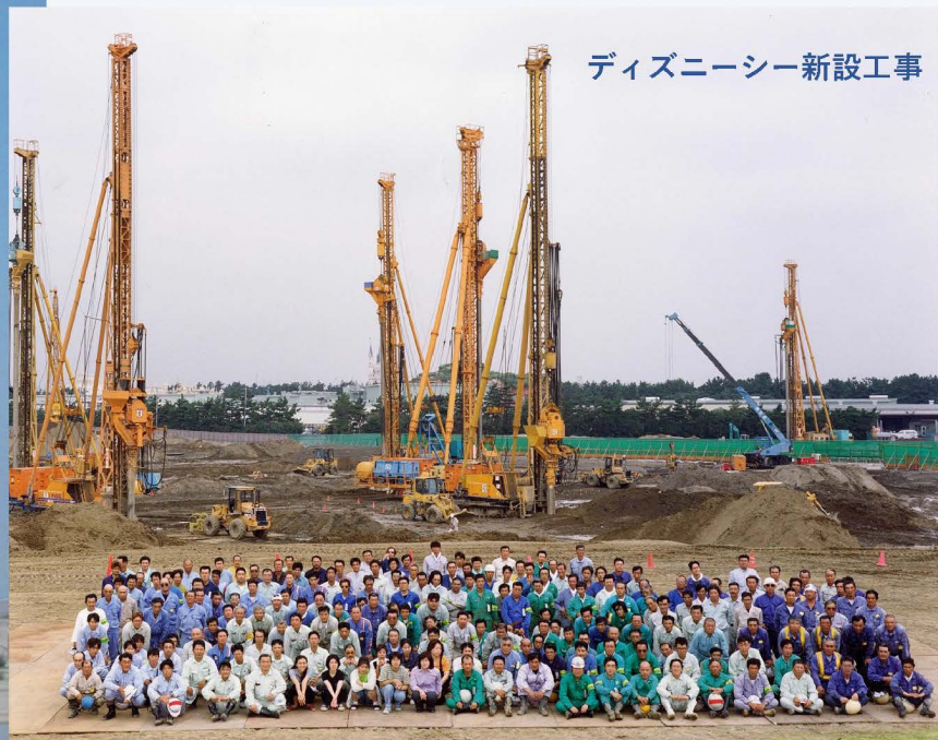
ディズニーシー新設工事