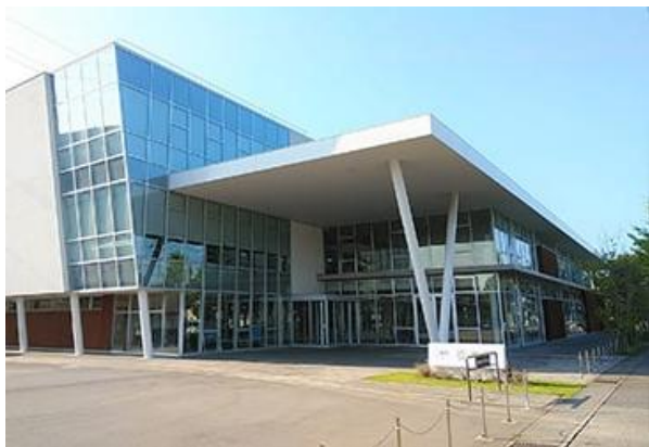
金沢工業大学 41 号館 (夢考房)