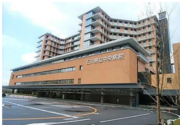
石川県立中央病院