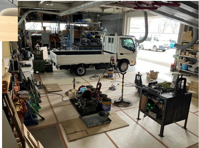
野々市営業所 加工場・倉庫