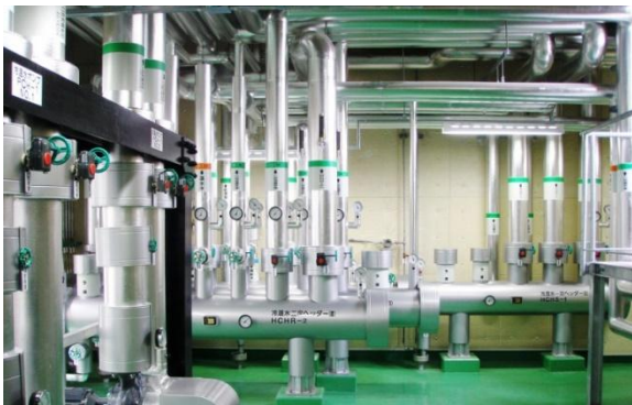
機械室 配管 (パイプ)