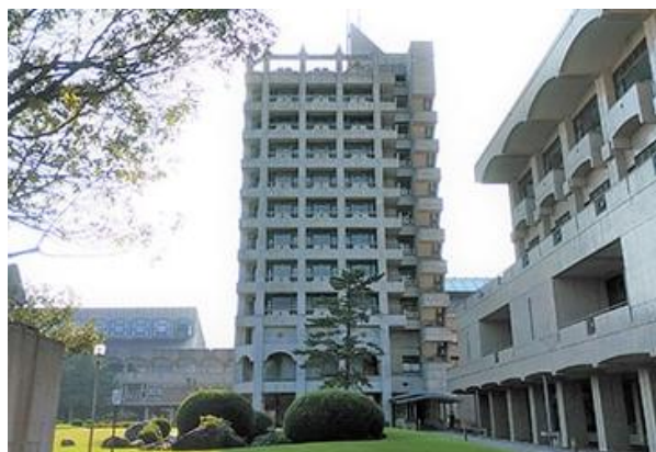
金沢工業大学 6 号館 (ライブラリーセンター)