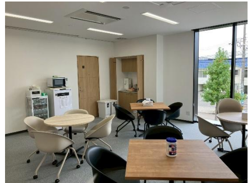
本社 休憩スペース