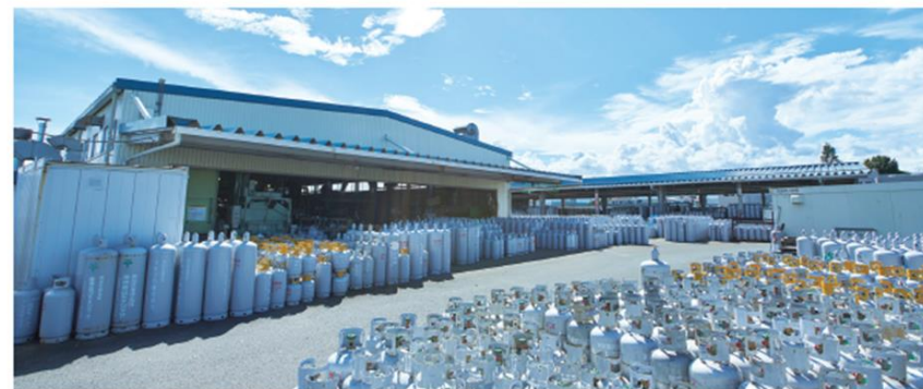
LPG容器 (川島・厚木工場) 耐圧本数150千本/年