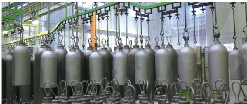
HPG容器 (東松山工場) 耐圧本数170千本/年