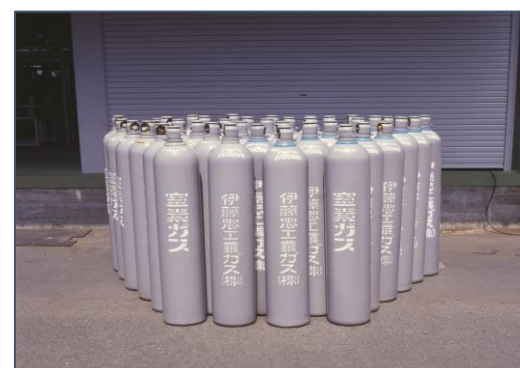
シリンダーポンプ