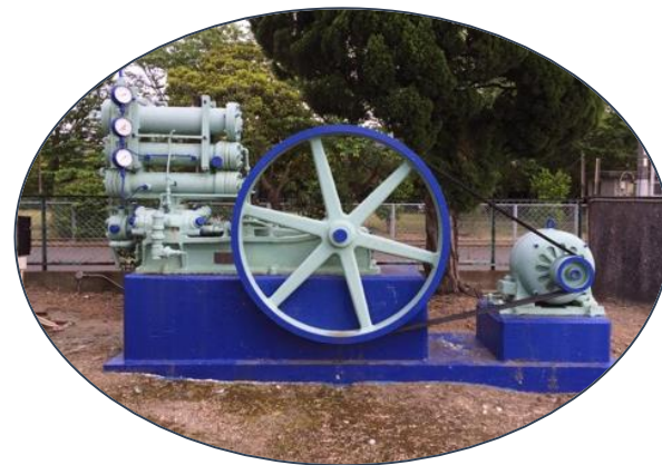
創業時の水電解によるガス製造機