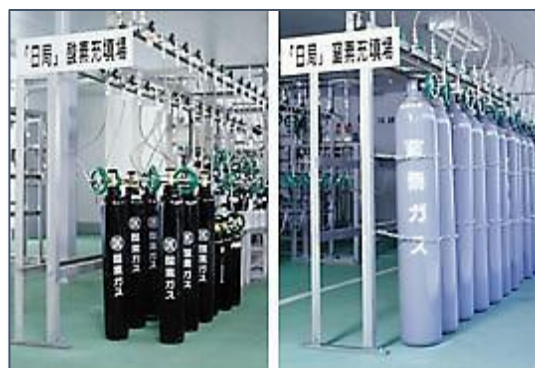
医療用ガス充填ライン