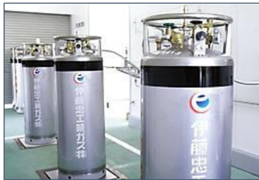
工業用液化ガス充填設備