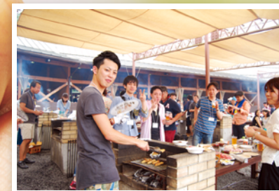
食品を扱う会社の特権、自社で仕入れたお肉でBBQ！社員同士の親睦も深まりました。