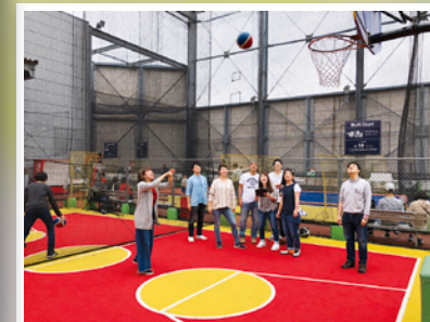
本格的でなくても体を動かすのは、 良いリフレッシュになります。