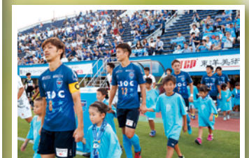
家族を連れて応援に行っています。 社員の子供たちは選手のエスコート キッズとして入場！