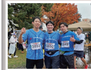
十勝物流センターがある帯広のフードバレーマラソン大会に協賛し、事業所のみならず参加し完走しました。