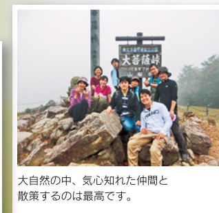
大自然の中、気心知れた仲間と 散歩するのは最高です。