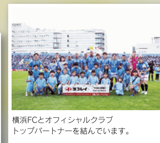
横浜FCとオフィシャルクラブ トップパートナーを結んでいます。