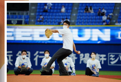
横浜DeNAベイスターズのヨコレイ冠試合！社員参加のイベントもあり、とても盛り上がりました。