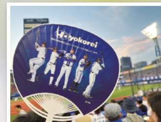
ヨコレイの冠試合では来場者に社名入りのうちわが配布されます。