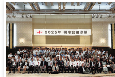
夏に開催された納涼祭には約350名の社員が参加。プロマジシャンによるマジック披露もあり大いに盛り上がりました！