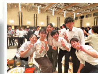
普段あまり話す機会のない他事業所の同期ともたくさん話して交流を深めることができました

仕事だけではなく、遊びや、イベントを通して、コミュニケーションが取れる場をたくさん開催しています！仕事では見ることが出来ない先輩社員の意外な一面が見えたり、様々な会話が出る絶好のチャンスです！地域貢献のイベント、社内懇親会、若手社員が集まってスポーツなど様々なイベントを事業所毎に行っています。たくさんの先輩たちと仲良くなり、仕事に行くのがさらに楽しくなりました！