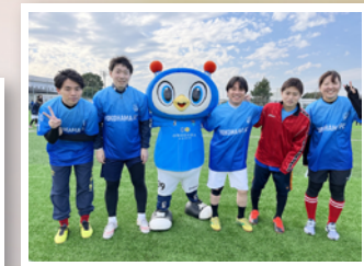
横浜FC主催のフットサル大会。事業所を超えた社員同士の交流の場もあります。