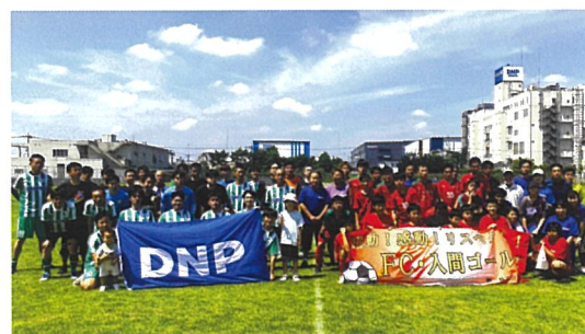
有志によるサッカー部 (FC入間ゴールズとの交流試合)

DNPテクノパックでは、20代、30代の社員をはじめ、幅広い年代の方が働いています。年齢関係なく楽しくコミュニケーションが取れていて、秋祭り、ボーリング大会、有志によるサッカー、ソフトボールなど社内イベントもたくさん開催されています！