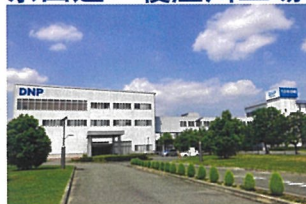
京田辺・寝屋川工場