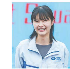
スマート農業 2023年入社 Sさん