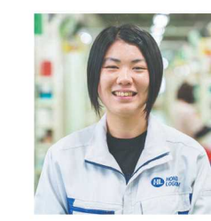
大口事業所 2025年入社 Tさん