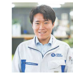
物流調査 2021年入社 Uさん