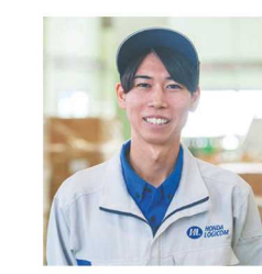
上郷事業所 2022年入社 Oさん