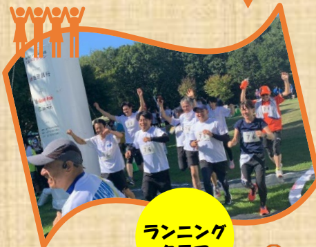
ランニング クラブ