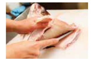
長次郎のこだわり ②