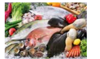
長次郎のこだわり ③