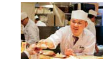
長次郎のこだわり ①