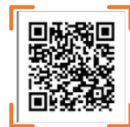
ドコモショップのお仕事 若手社員インタビュー