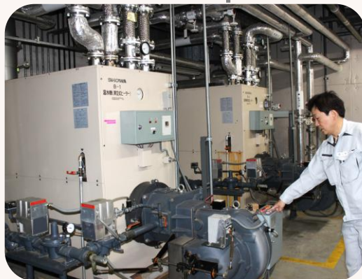
ボイラー管理で浴場の お湯の準備