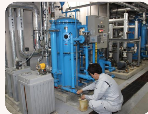
浴場の塩素濃度の測定