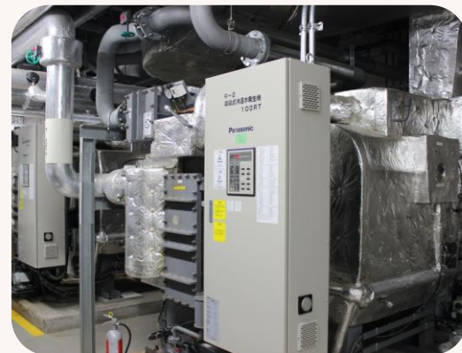
冷温水発生機で館内の 冷暖房管理